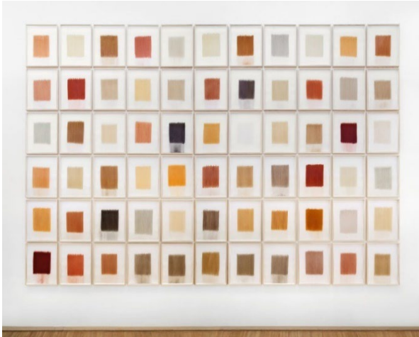
herman de vries, from earth: europe, 2016; Foto: Horst Kurschat