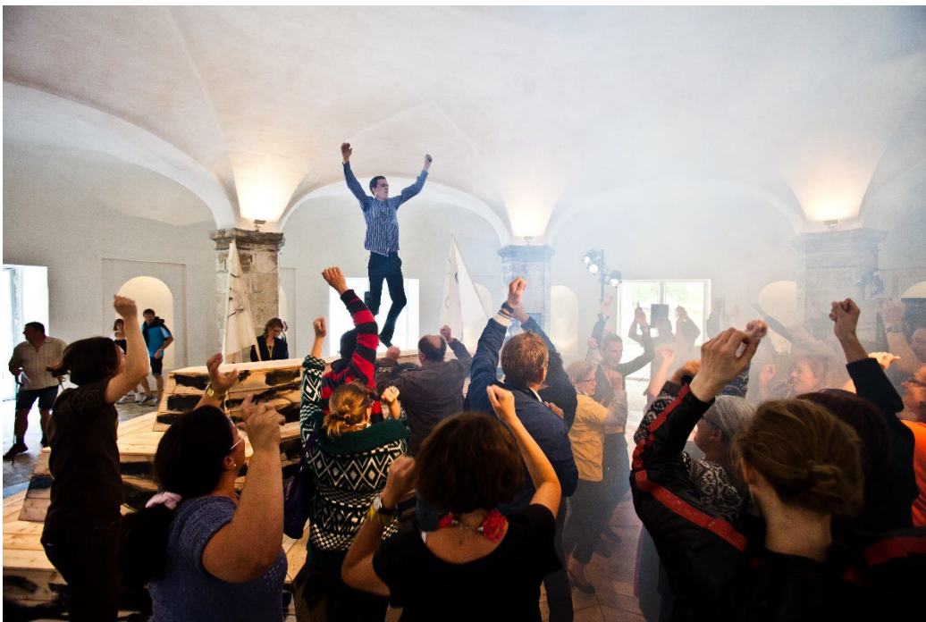
Performance „Collaboration“ © Christian Falsnaes