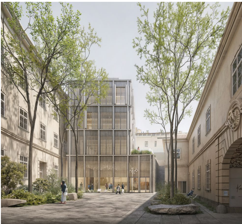
Visualisierung: hdgö im MQ