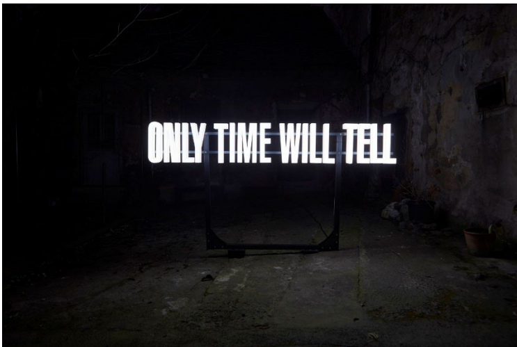
Only Time Will Tell © Driton Selmani