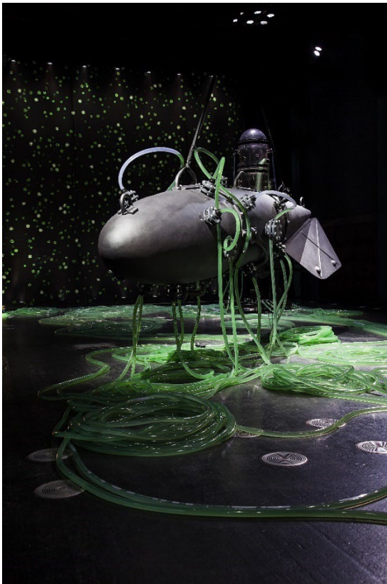
HYDRA © Thomas Feuerstein, 2020