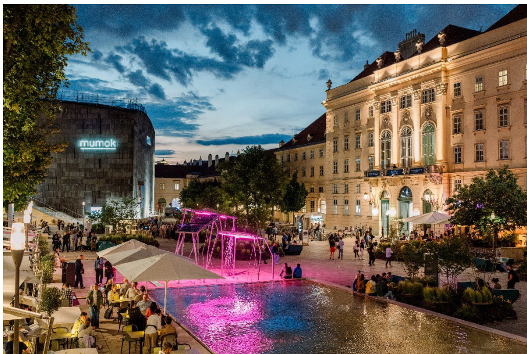
MQ Haupthof