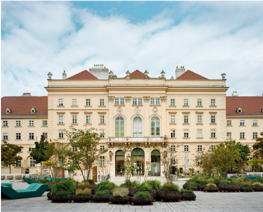
MQ Haupthof