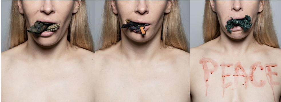
KRIE(K)G © Inna Schewtschenko & Elsa Okazaki