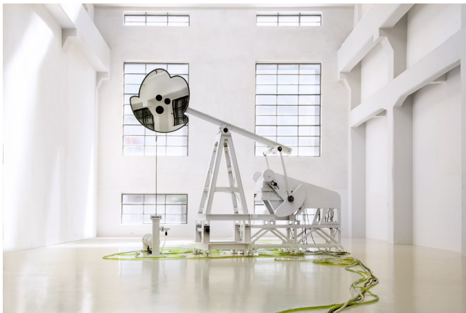
Thomas Feuerstein, MOBY DICK, 2023, Museion Bozen