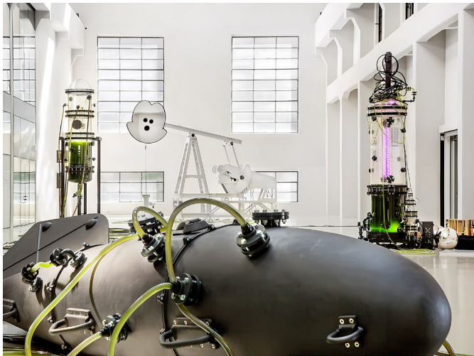
Ausstellungsansicht: HOPE, NOI Techpark, Museion, Bolzano, 2023 | Thomas Feuerstein, METABOLICA, 2023 & MOBY DICK, 2023