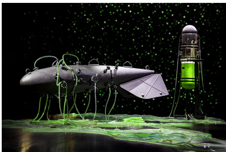
Thomas Feuerstein, HYDRA, 2020, Muffathalle München