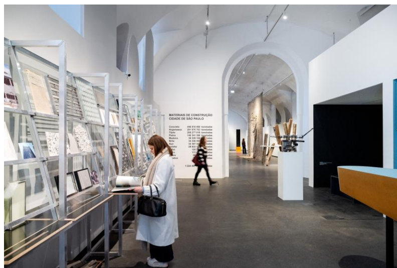
Ausstellungsansicht „THE MATERIAL SHOW“, MQ Freiraum, 2026