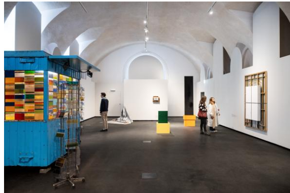
Ausstellungsansicht „THE MATERIAL SHOW“, MQ Freiraum, 2026