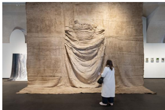
Ausstellungsansicht „THE MATERIAL SHOW“, MQ Freiraum, 2026 © LITTLE WARSAW, Marble Street, 2000, Courtesy Galerie Erna Hécey | MuseumsQuartier Wien, Foto: Simon Veres