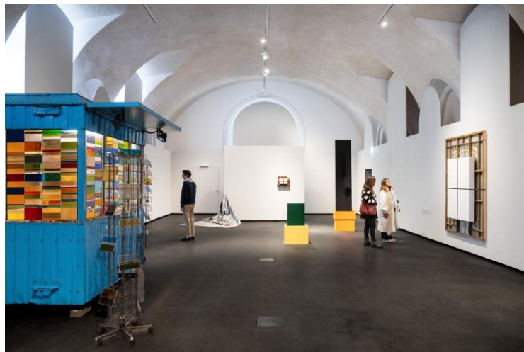
Ausstellungsansicht „THE MATERIAL SHOW“, MQ Freiraum, 2026