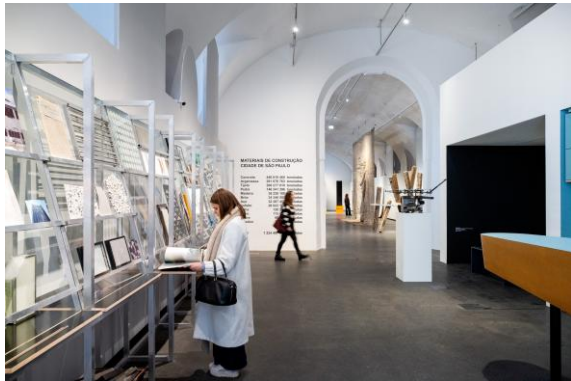
Ausstellungsansicht „THE MATERIAL SHOW“, MQ Freiraum, 2026