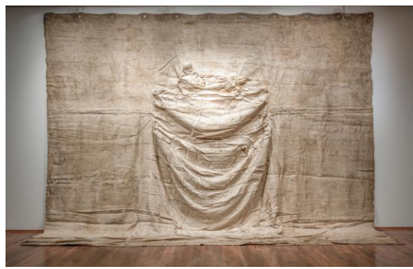
LITTLE WARSAW, Marble Street, 2000