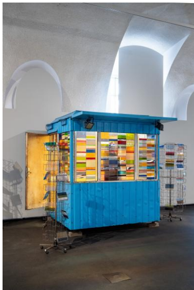
Ausstellungsansicht “THE MATERIAL SHOW”, MQ Freiraum 2026 © Daria Koltsova, Kiosk (2025) and Postcards from Home (2024–25), Courtesy of the artist | MuseumsQuartier Wien, Foto: Simon Veres