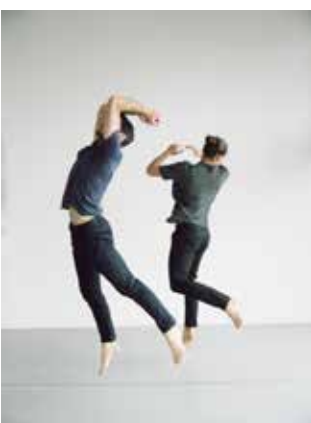
NOÉ SOULIER Faits et gestes

Kinderbetreuung während der Premiervorstellungen! weitere Infos unter: www.tqw.at/neu-kinderbetreuung