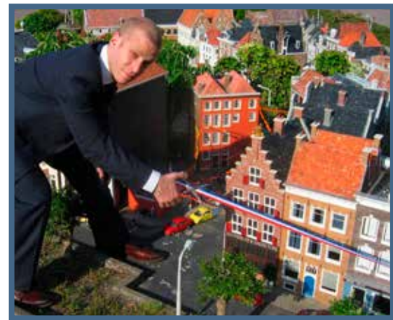
Herzog Nadler: Stimmt. Fotografie, Detail der Zeitung The Monograph, 2006.

Datum: 31.03. bis 28.05., Di–So 13–20h Eröffnung: Do 30.03., 19h Ort: frei_raum Q21 exhibition space Eintritt frei