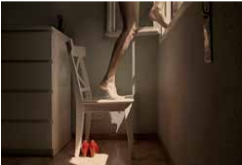
Am Ende: Architektur. Zeitreisen 1959–2019