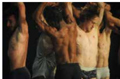
Tanzquartier Wien ALAIN PLATEL / LES BALLETS C DE LA B nicht schlafen

und über 100 weitere Ausstellungen, Veranstaltungen und Workshops