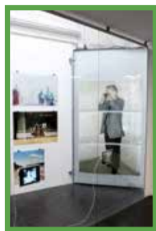
© ORTHOCHROME / Foto Ausstellungsansicht © Kristian Achtsaich