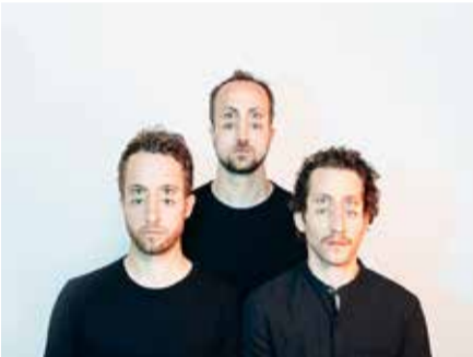
Elektro Guzzi