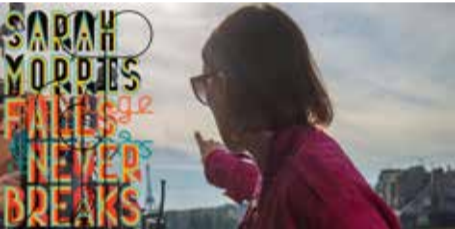
Sarah Morris: Falls Never Breaks Kunsthalle Wien 2016, Design by M/M (Paris), 2016