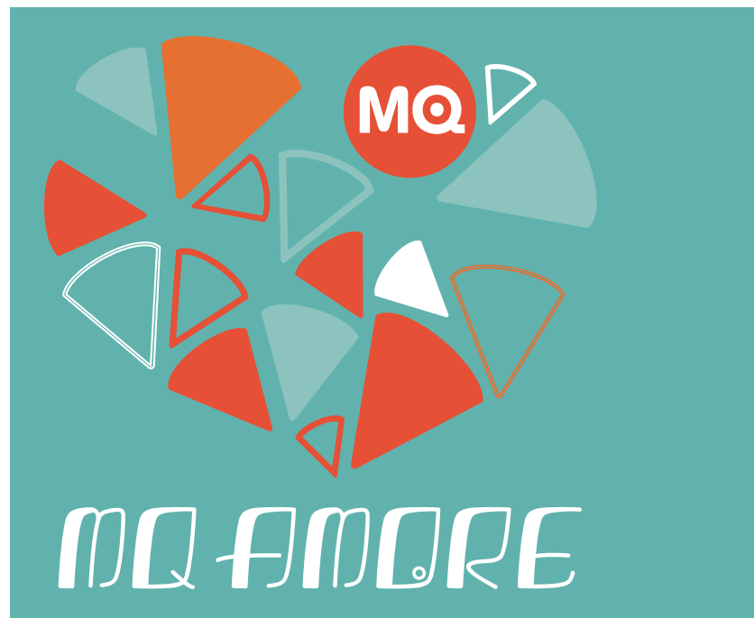
MQ Amore © MuseumsQuartier Wien