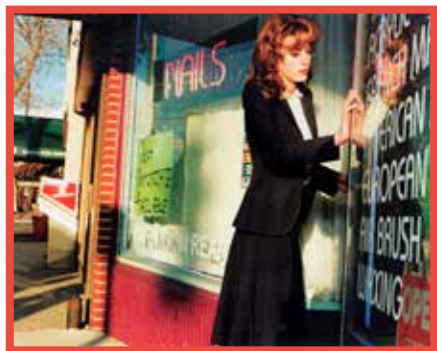
New Jersey Shopping, 2003/2006 © Elfie Semotan

Datum: 10. bis 30.04., täglich 10–22h Ort: EIKON Schaufenster Eintritt frei