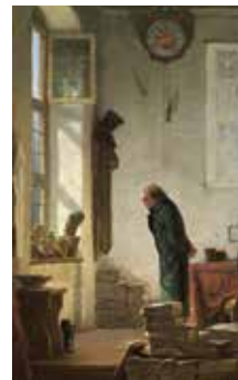
Carl Spitzweg, Der Kaktusliebhaber, 1850, Museum Georg Schaller, Schweinfurt