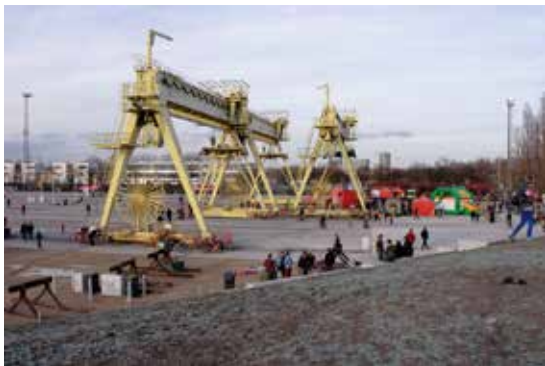
Zur Veranstaltung: ROTOR. Werkvortrag Rotor, Spoor Oost Project, Antwerpen/BE, 2014–2015