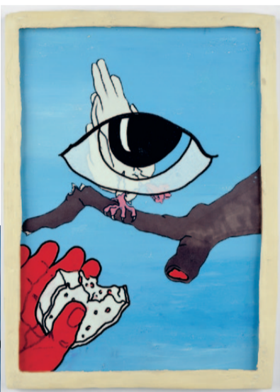
KUNSTHALLE wien Urs Fischer, Was ist der beste Satz den du je gehört hast? © Urs Fischer, Courtesy der Künstler und Galerie Eva Presenhuber, Zürich