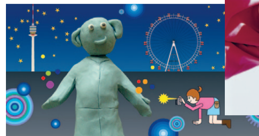
ZOOM Kindermuseum Flaschenzauberland