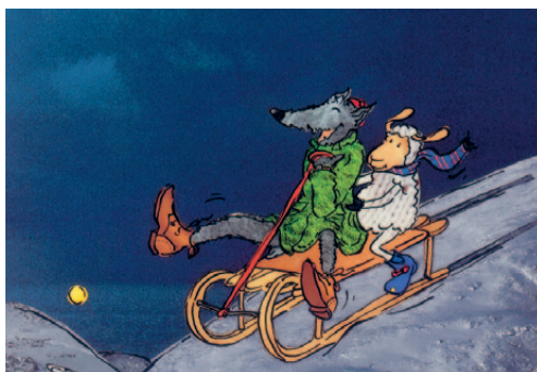
DSCHUNGELE WIEN Ein Schaf fürs Leben Illustration Anke Faust © Verlag Friedrich Oetinger, Hamburg

ÖFFNUNGSZEITEN: Mo bis Fr 14.30–18.30h, Sa, So & Fei 16.30–18.30h INFORMATION UND RESERVIERUNG: Tel.: 01/522 07 20 20 tickets@dschungelwien.at www.dschungelwien.at