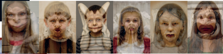
TONSPUR 48 © Gary Hill

quartier21 quartier für Digitale Kultur, Mode und Design MQ, Museumsplatz 1, 1070 Wien Gesamtprogramm unter: www.quartier21.at