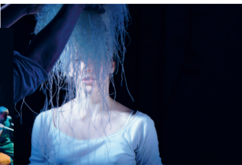
Tanzquartier Wien Mush Room