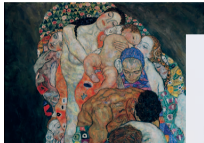
LEOPOLD MUSEUM Klimt Persönlich Gustav Klimt, Tod und Leben, Ausschnitt, 1910/15, Leopold Museum

ÖFFNUNGSZEITEN: täglich außer Di 10–18h; Do 10–21h Tel.: 01/525 70-0 Fax: 01/525 70-1500 office@leopoldmuseum.org www.leopoldmuseum.org EINTRITT: € 11,- / verschiedene Ermäßigungen