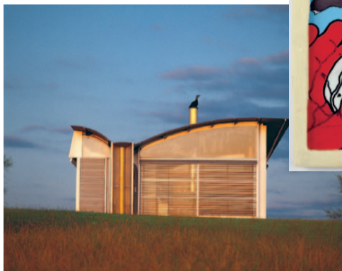
Az W Glenn Murcutt Magney House

ÖFFNUNGSZEITEN: Ausstellungen + Az W Info täglich 10–19h Bibliothek Mo, Mi, Fr 10–17.30h; Sa & So 10–19h, bis 08.01. geschlossen Tel.: 01/522 31 15, Fax: 01/522 31 17, office@azw.at, www.azw.at EINTRITT: 1 Ausstellung € 7,- / € 4,50, Kombi-Ticket (2 Ausstellungen) € 9,- / € 6,50 Familienkarte: 1 Ausstellung € 10,- / 2 Ausstellungen € 14,-