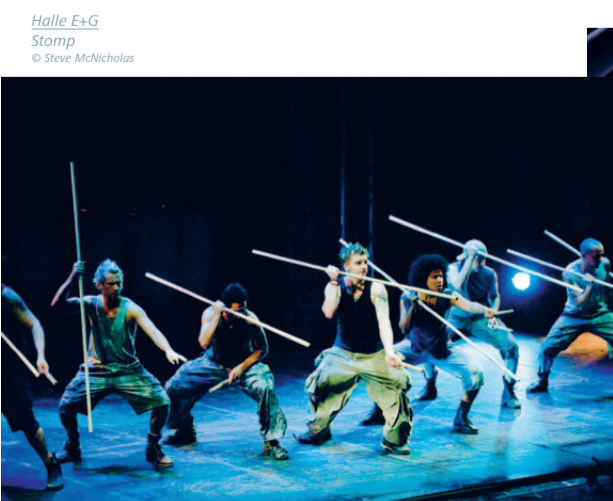
Halle E+G Stomp