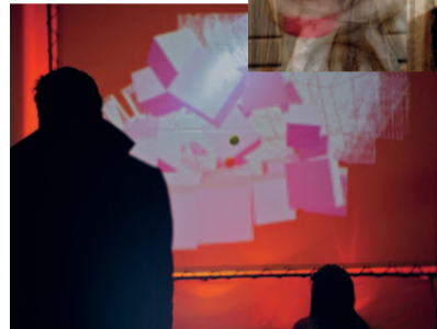
Artistic Research Technology Lab