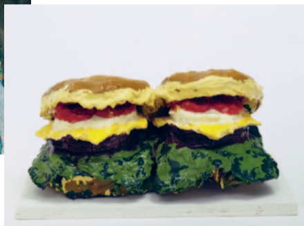
mumok Claes Oldenburg Two Cheeseburgers, with Everything Duff Hamburgers, 1982 Courtesy MoMA, New York © Claes Oldenburg