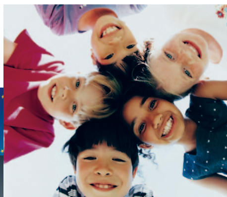
wienXtra-kinderinfo © wienXtra