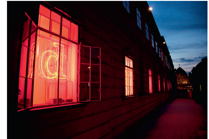
ELECTRIC AVENUE / © RAIMO RUDI RUMPLER

Rund 40 internationale KünstlerInnen, die neben Bildender Kunst in den unterschiedlichsten Sparten wie Mode, Design, Fotografie, Street Art, Game Culture, Konzeptkunst, Theorie und Medienkunst arbeiten, werden jährlich über das Studioprogramm eingeladen, für rund zwei Monate im MuseumsQuartier zu leben und Projekte mit den ansässigen Kulturinitiativen im quartier21 zu verwirklichen. Bei diesem Rundgang öffnen internationale GastkünstlerInnen ihre Studiotüren. Welche Artists-in-Residence gerade im MQ leben und arbeiten, finden Sie auf unserer Website: www.quartier21.at