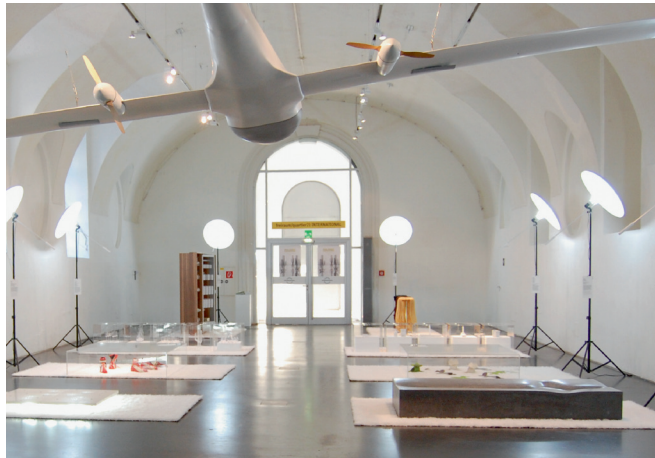
FREIRAUM QUARTIER21 INTERNATIONAL

Konzipiert als Ergänzung und Kontrast zu den großen Institutionen im MQ (MUMOK, LEOPOLD MUSEUM, KUNSTHALLE wien, Architekturzentrum Wien) sorgt das temporäre Nutzungskonzept des quartier21 dafür, dass das MQ ständig in Bewegung bleibt. Mittlerweile sind unter dieser Dachmarke rund 60 autonome Initiativen – vorwiegend in den Bereichen Digitale Kultur, Mode und Design – aktiv. Ihre Arbeits-, Präsentations- und Begegnungsräume finden sich auf dem gesamten MQ-Areal verstreut. Erkunden Sie mit uns den Produktionsort quartier21.