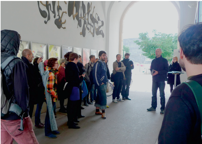
TYPOPASSAGE / © BAUER - KONZEPT & GESTALTUNG